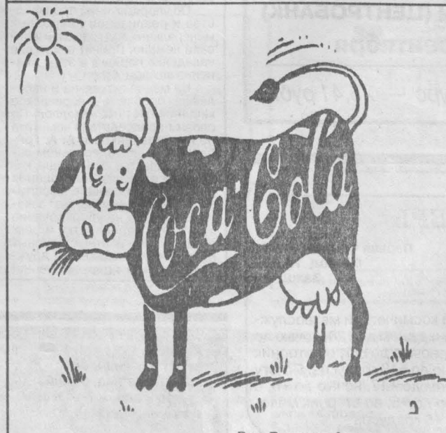
Рис. Василия Александрова.

Китайские исследователи опубликовали в журнале «Nature» отчет о реконструкции останков неизвестного вида динозавра, получившего название Sinornithosaurus millenii. Это было симпатичное существо с фигурой бройлера, размером около метра, покрытое перьями. И, в отличие от большинства крылатых динозавров, которым конструкция плечевого пояса позволяла скорее парить, чем нормально летать, этот свободно хлопал крыльями, как птица. Находка подтверждает правоту сторонников происхождения птиц именно от динозавров. ABCNews.