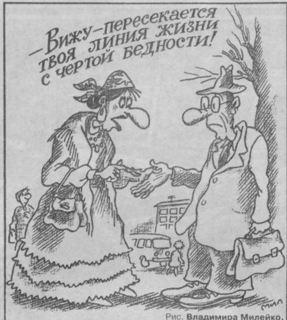
Рис. Владимира Милейко.

делка, которая таит в себе коть малейший риск. Сомнительное предприятие обернется самыми негативными последствиями. Постарайтесь до конца недели упрямиться со всеми делами, которые у вас скопились. Супружеский дуэт преуспешен в достижении поставленных целей. Давние любовники решат скрепить отношения брачным контрактом.