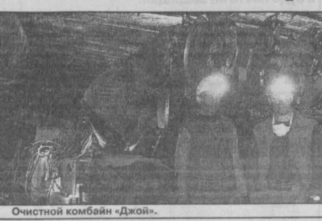
Очистной комбайн «Джой».

Сегодня я предлагаю вам, школьники и студенты, сочинение на свободную тему «Кузбасс в XXI веке». Это ваш шанс быть услышанными уже сейчас, не дожидаясь, когда вам официально раздается слово во взрослую жизнь. Это шанс и для нас, взрослых, не нарушая связь поколений, услышать ценное и полезное.