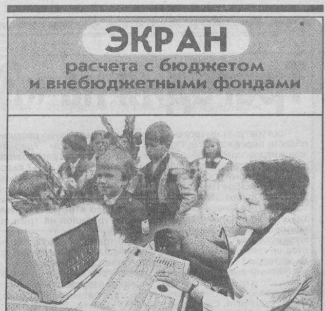
Экран расчета с бюджетом и внебюджетными фондами