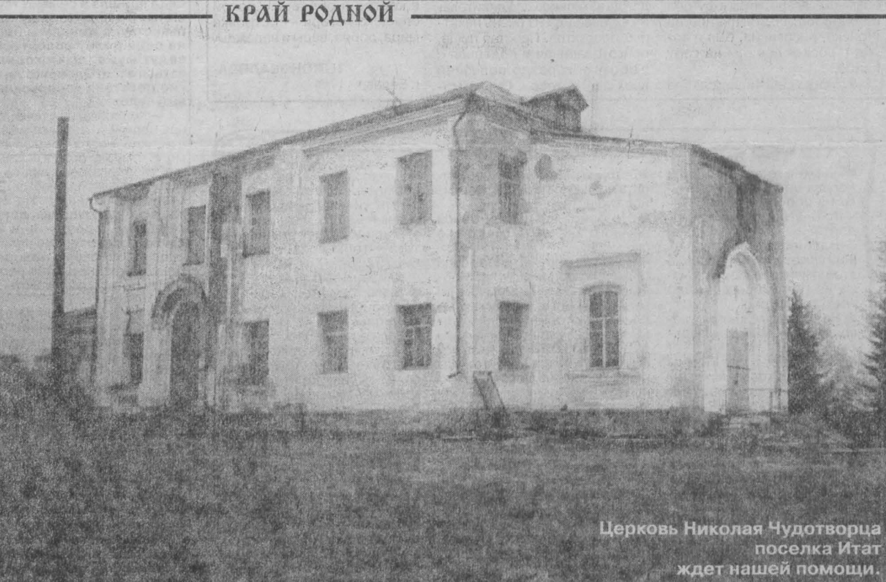
Церковь Николая Чудотворца поселка Итат ждет нашей помощи.