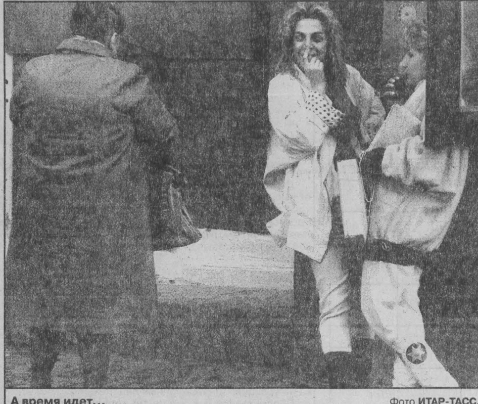
А время идет...