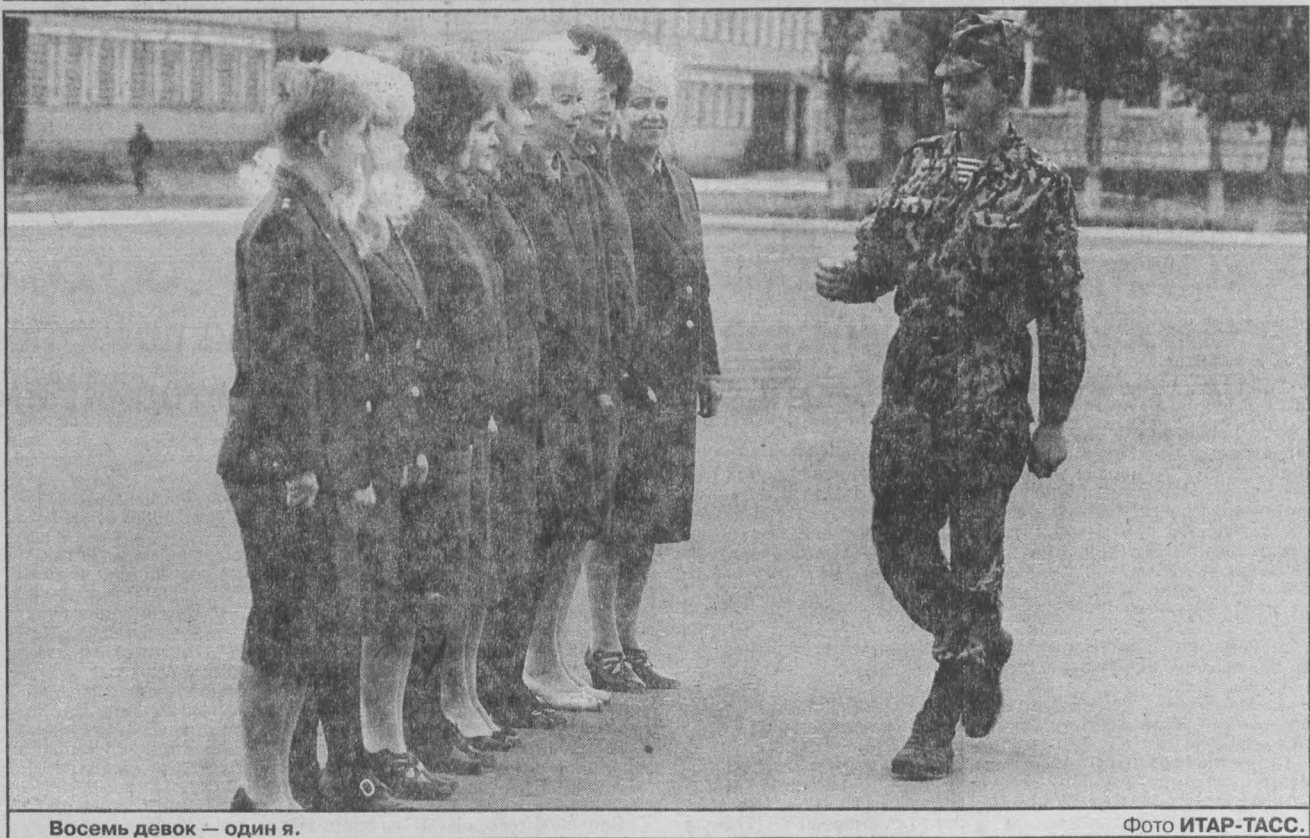
Восемь девок — один я.