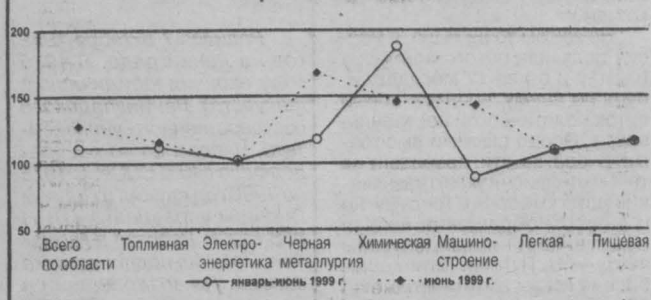
Динамика объема промышленного производства в процентах к соответствующему периоду прошлого года

Увеличился выпуск продукции в электроэнергетике на два процента, черной металлургии — на 18 процентов, топливной промышленности — на 12 процентов, химической и нефтехимической — в 1,9 раза, пищевой — на 16 процентов, легкой промышленности — на 9 процентов.