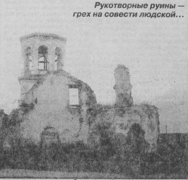
Современный вид Ишимской церкви.

всмотритесь в эту печальную фотографию... О том, чем жил-мог ишимский храм век с небольшим назад, мы узнали из архивных материалов — сохранилась "Ведомость о Спасской церкви Томского округа, села Ишимского за 1889 год..." "...Здание каменная, с таковою же колокольнею. Престолом в ней три: в настоящей холодной был во имя Спаса Нерукотворенного. В приделах: с левой стороны — во имя святителя Николая, с правой стороны — во имя святителя Иннокентия. Утварью достаточна; число полных священнических облачений семь, потиров три: с полной принадлежностью — один, а другой только без ковшечки, третий же только со звездичкою. Евангелий четыре; потиры и кресты серебряные. Из Евангелий одно ковчаное серебряное. Причащено положено по высочайше утвержденному для Томской епархии штату: священник и псаломщик; столько же и на лицо состоит. Земли при сей церкви усадебной нет, пахотной 90 десятин и 9 сенокосной. Планы на сию землю есть и хранятся в целости. Сенокосная земля попользуется священно-церковнослужителями, а пахотная с 1869 года владеют прихожане и платят причту ругу — зерном ржаной хлеб в количестве 475 пудов в год. Священно-церковнослужители получают жалованья из губернского казначейства 200 рублей в год, а именно: священник 160 рублей, псаломщик 40