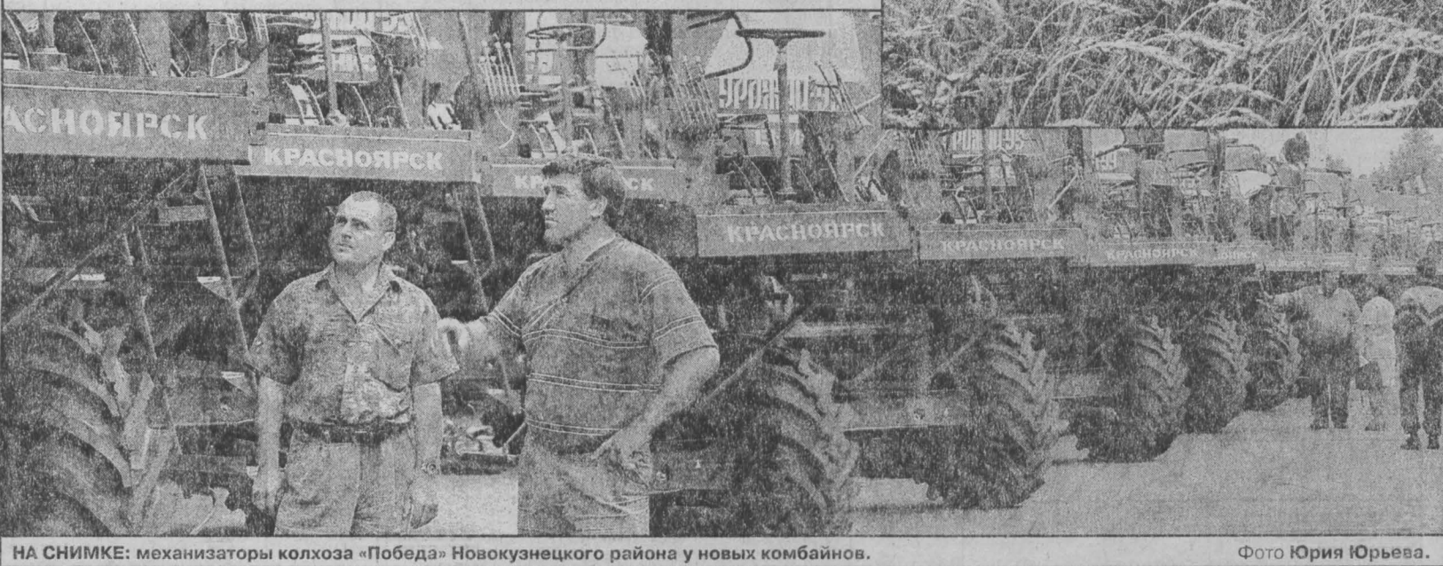
НА СНИМКЕ: механизаторы колхоза «Победа» Новокузнецкого района у новых комбайнов.

200 тыс. рублей платят хозяйства, остальные деньги выделяются из областного бюджета.