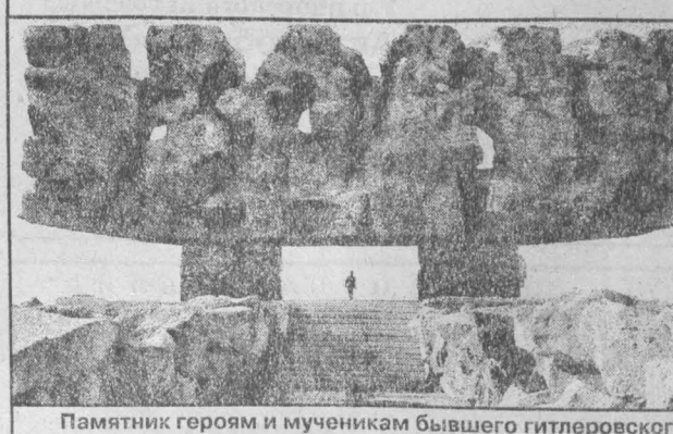
Памятник героям и мученикам бывшего гитлеровского концлагеря Майданек.