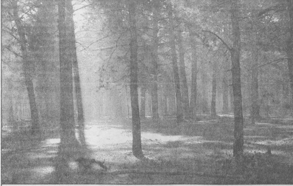
Кемерово. Сосновый бор.