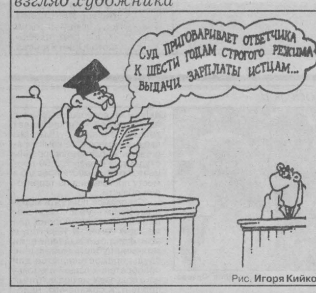
Рис. Игоря Кийко.