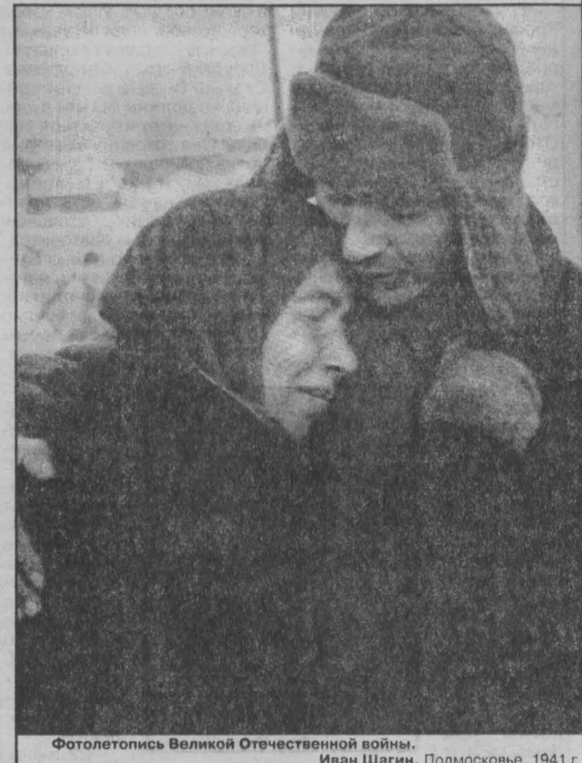
Фотолегислы Великой Отечественной войны. Подмосковье. 1941 г.