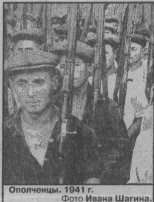
Ополченцы. 1941 г.

Это особенно важно сейчас, на рубеже XXI века, накануне нового тысячелетия. Ведь человечество вооружено до зубов, в том числе самым страшным, самым разрушительным оружием. А кровавые мельницы войны никогда не прекратят свою работу. После окончания второй мировой войны и военных конфликтов.