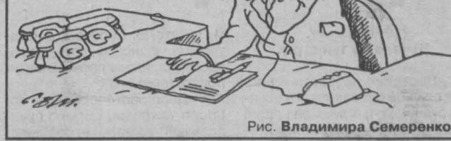
Рис. Владимира Семеренко.