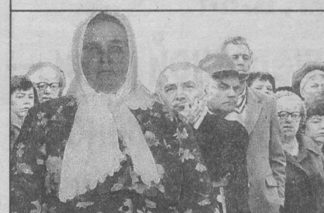
Отрадно отметить, что в области значительно улучшилось положение с выплатой пенсий.

Так, на 3 июня задолженность перед пенсионерами составила 368 млн. рублей при потребности 417 млн. рублей в месяц. Ситуация изменилась благодаря помощи Пенсионного фонда России и стараниям многих предприятий области. Их руководители понимают всю важность своевременного внесения обязательных платежей в Пенсионный фонд и стараются найти возможность их осуществить.