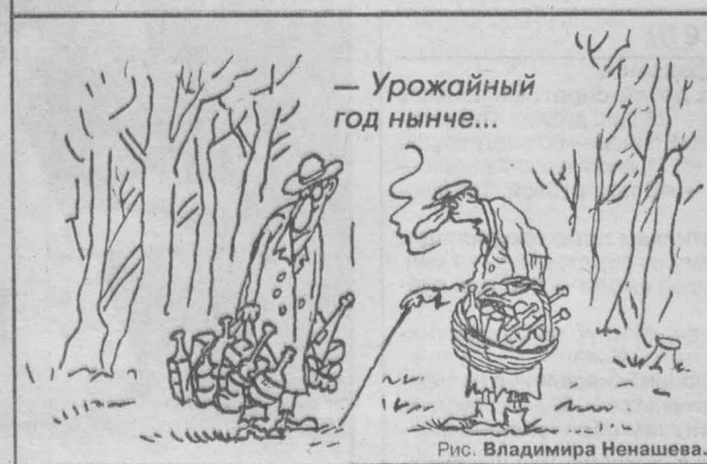
Рис. Владимира Ненашева.