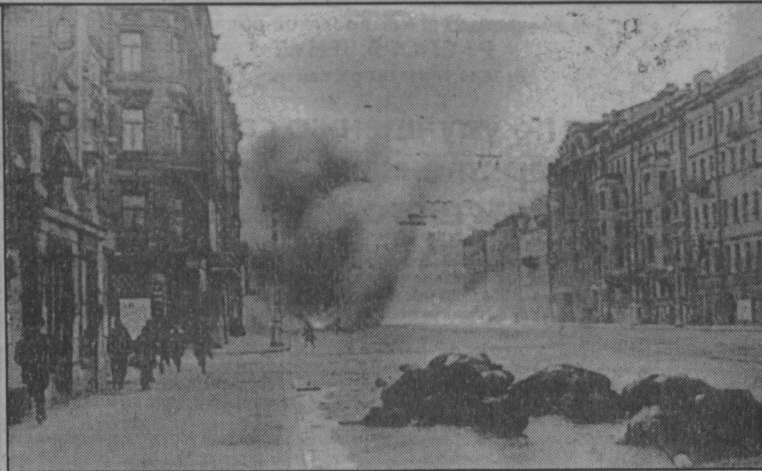
Невский во время артобстрела. 1942 г.

Мы благодарны той власти, что убергла, всколыхнула и воспитала, дала образование и ра-