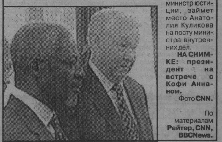
По материалам Рептер, CNN, BBCNews.

Сам же Кириенко в этот день в интервью охарактеризовал себя как человека президента и дал понять, что предпочитает держаться в стороне от политики, считает прежний состав правительства излишне политизированным и намерен изменить ситуацию. Уже известно об одном новом назначении: Сергей Степашин, бывший