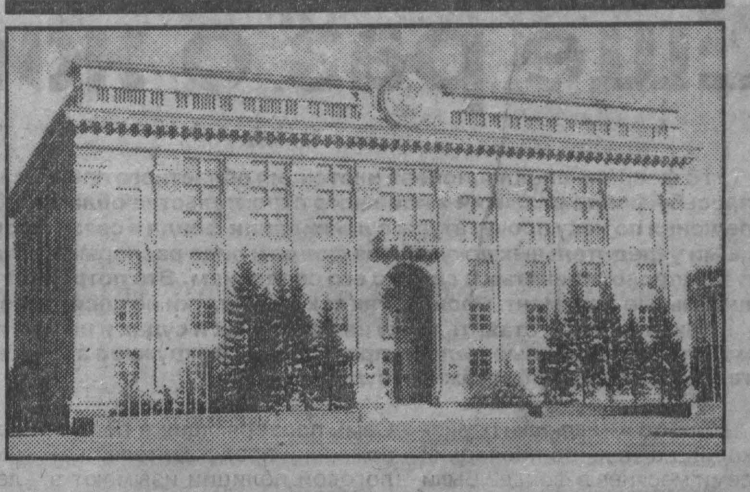
сессия Законодательного собрания