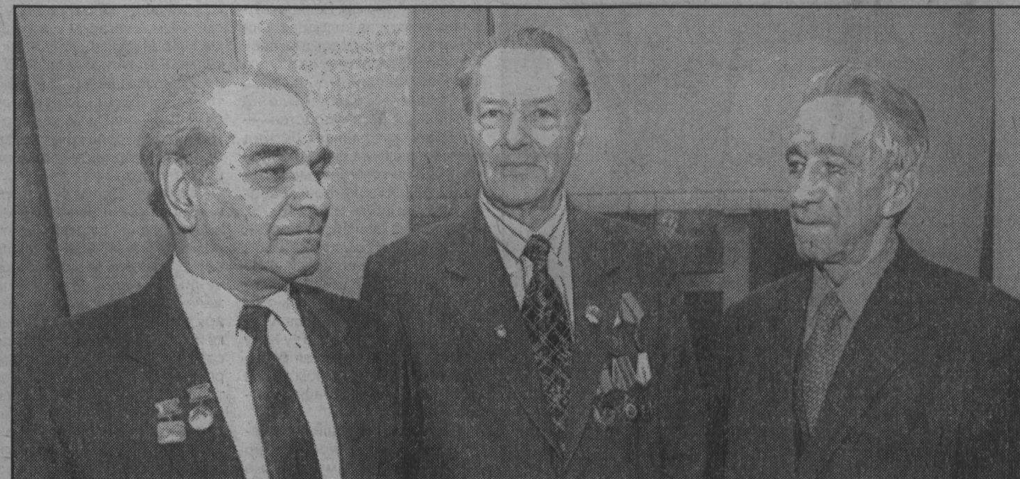
поздравляем! Заслуженным строителям — слова благодарности

В поддержку предпринимателей Вчера в соответствии с губернаторской программой создания рабочих мест в Кемеровской области перечислено 8,5 млн. рублей государственному региональному фонду развития и поддержки предпринимателей. В том числе направлено: 2,5 млн. рублей — для возобновления работ и увеличения объемов производства на Новокузнецком мясокомбинате (50 рабочих мест); 2 млн. рублей — для увеличения объемов производства мяса на Чистогорском сельскохозяйственном комбинате (80 рабочих мест); 4 млн. рублей — департаменту сельского хозяйства для производства посевных агрегатов «Конкорд», которые по Kooperation производится на Юргинском машиностроительном заводе (150 рабочих мест) и кемеровском «Автоагрегате» (50 рабочих мест). Готовы уже 106 машин. Однако не хватает необходимых запчастей, которые производятся только в США. На их закупку и выделены названные 4 млн. рублей.