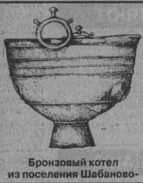
Бронзовый котел из поселения Шабаново.

Кузнецкая котловина — межгорная впадина в центральной и северо-западной частях Кемеровской области.