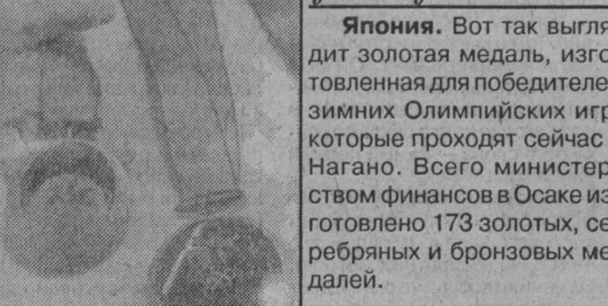
Япония. Вот так выглядит золотая медаль, изготовленная для победителей зимних Олимпийских игр, которые проходят сейчас в Нагано. Всего министерством финансов в Осаке изготовлено 173 золотых, серебряных и бронзовых медалей.