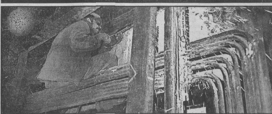
Монтажные работы на 5-м котле Юргинской ТЭЦ.

Министерство труда и социального развития РФ направило в Кузбасс импортную бытовую технику для детских приютов Анжеро-Судженска, Мысков и Гурьевского районов (п. Урс). Каждый из них получит стиральную машину, электроплиту, морозильную камеру и холодильник.