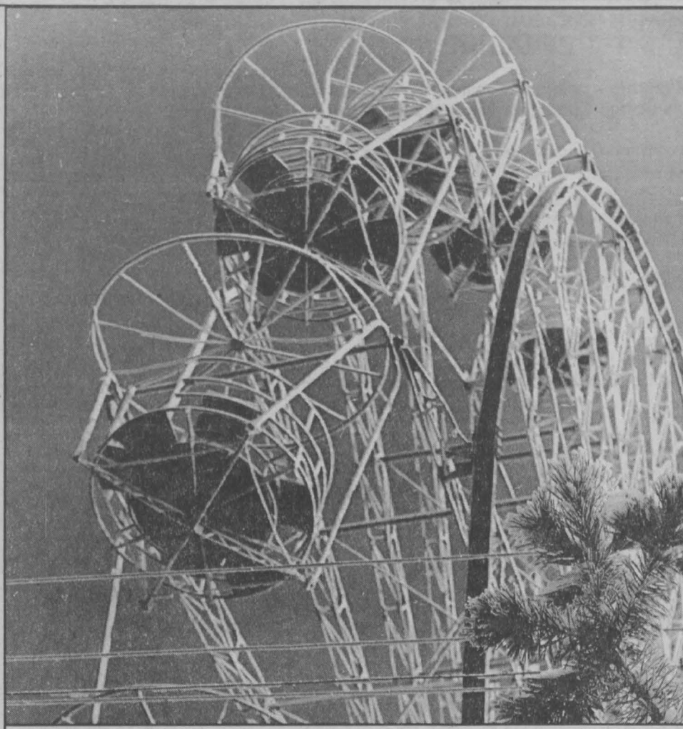
В городском саду.