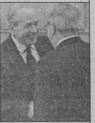
Фотомонтаж: Евгений Примаков приветствует Мишеля Камдессю.

В среду исполнительный директор Международного валютного фонда Мишель Камдессю в беседе с журналистами одобрил усилия российской администрации по выводу из кризиса, но дал понять, что скорой денежной помощи не будет. В январе в Москву вернутся эксперты фонда, и если правительство представит им новые практические и реальные предложения, очередной транш кредита будет заморожен.