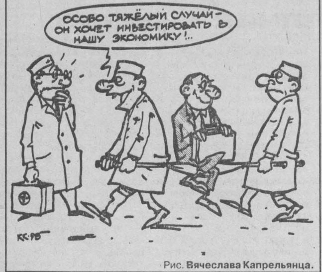
Рис. Вячеслава Капрельянца.