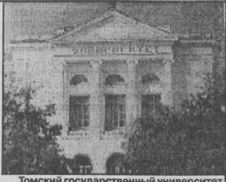
Томский государственный университет.

Раньше, все эрэфэсэровские студенты существовали примерно одинаково. Получает, скажем, кемеровский политеховец свои сорок на деревянных, а самых что ни на есть полноценных рублей, и томский питомец университета получает ровно столько же, копейка в копейку. Причем каждый месяц. Программы учебные везде были одни и те же — что в Новосибирске, что в Красноярске. Меню во всех студенческих столовых страны утверждалось не иначе как на совместной сессии общепита и Министерства образования в Москве: будь ты сибиряк или уралец, физик, лирик или ботаник — везде тебя ждал один и тот же «шницель заиндевелый двояковыпуклый — 12 коп. шт.) Ну и так далее.