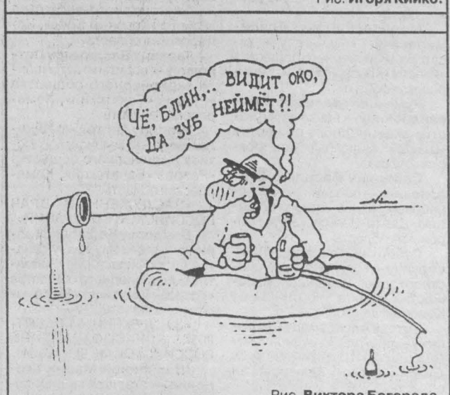
Рис. Виктора Богорада.