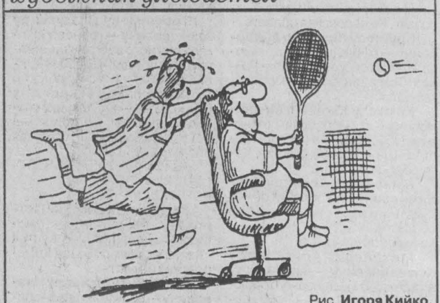
Рис. Игоря Кийко.