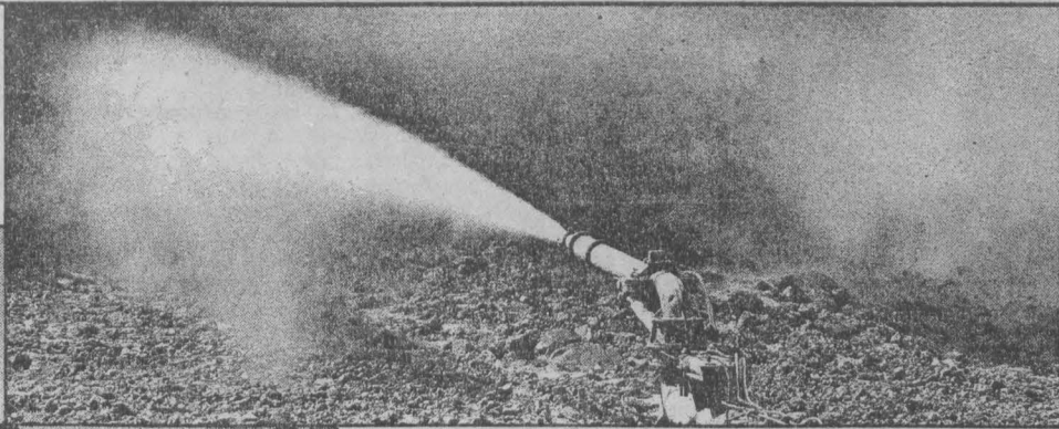
водными парами. Таким же путем уничтожается и страшная при взрыве угольная пыль. В самой же шахте полезное ископаемое превращается в концентрат, который прямо отсюда отправляется на коксохимические и металлургические заводы. Новая технология уже отрабо-

ботана на шахтах «Нагорная-1», «Нагорная-2», на «Краснокаменской» в Кедровская, а также на шахте «Киселевская». Основные показатели работы этих предприятий намного превышают экономические данные лучших «сухих» шахт Кузбасса, в том числе и «Распадская». Себестоимость тонны угля на гидрошахтах института всего 65-70 рублей, а производительность труда рабочего превышает 360 тонн в месяц, тогда как на передовых предприятиях области она только 100-120 тонн. Существенный плюс новой гидравлической технологии добычи угля — возможность построить шахту быстро (всего за 6 месяцев) и дешево