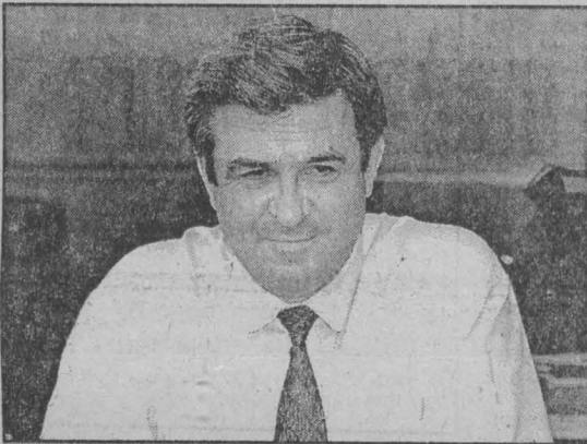
слово — «генералу»