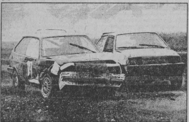
г. Киселевск.

Олег КУРОЧКИН. г. Кемерово.