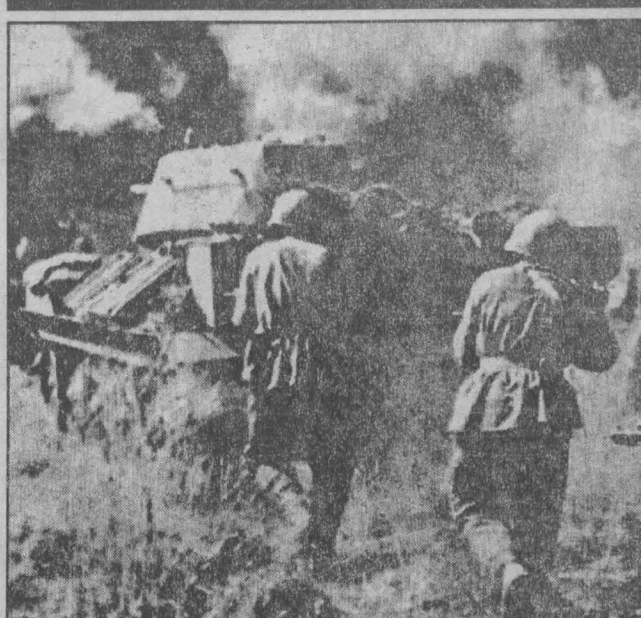
Курская битва.