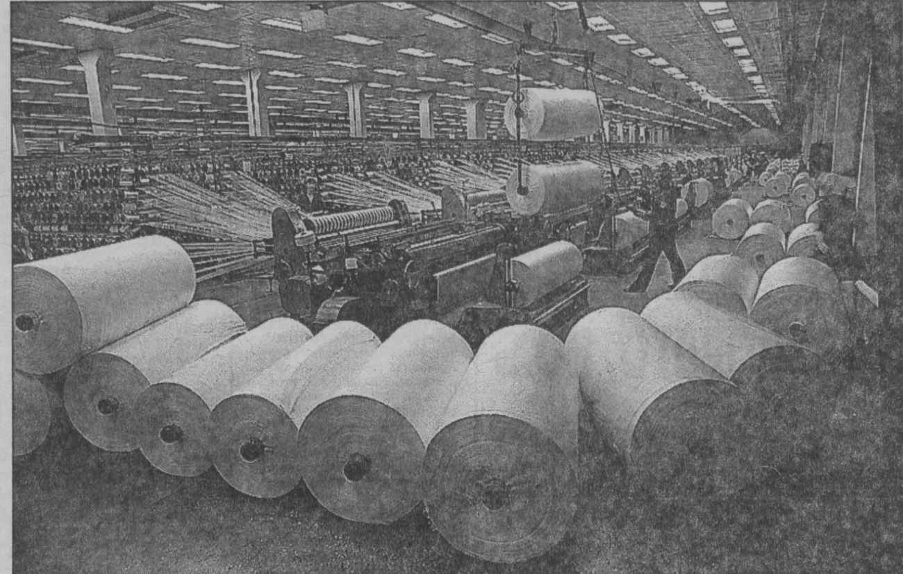
кузбасскому корду — 25 лет