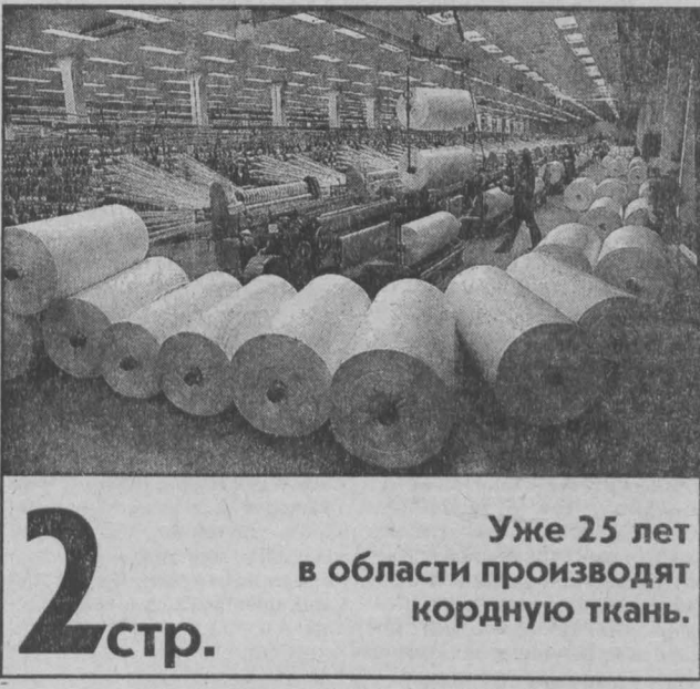
Уже 25 лет в области производят кордную ткань.