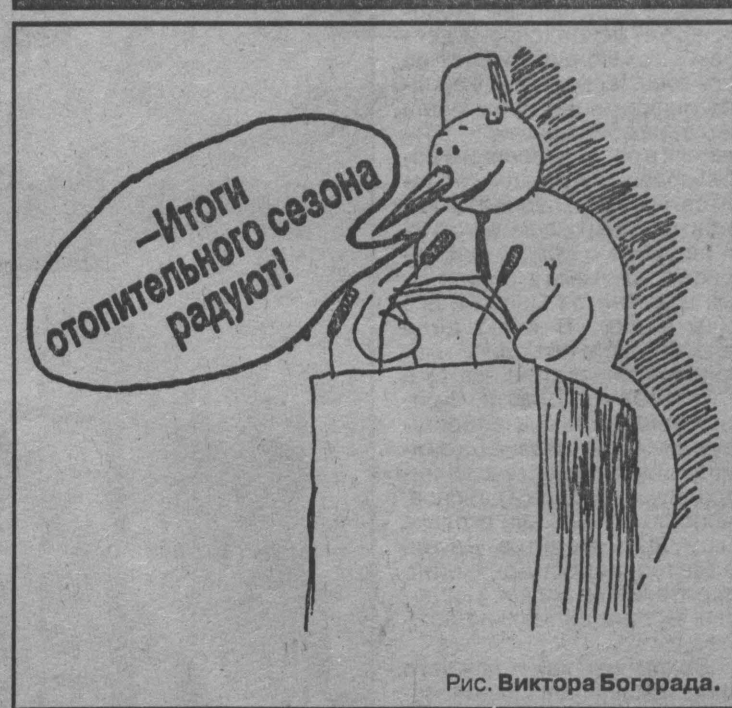
Рис. Виктора Богорада.