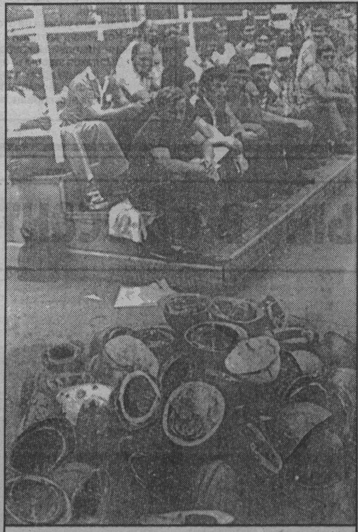
Конец «перестроечных» восьмидесятых ознаменовался всплеском народного недовольства. Первая шахтерская забастовка июля 89-го всколыхнула всю страну. Шахтеры на площади Советов в Кемерово.

Расширение полномочий Советов требовало также новых подходов во взаимоотношениях с предприятиями. Повысилась координационная роль Советов, руководители плановых органов возведены в ранг заместителей председателей исполкомов. На заседаниях исполкомов стали рассматриваться иные вопросы. Например, о работе угольных