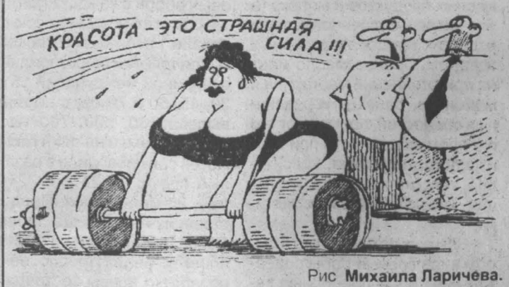
Рис Михаила Ларичева.