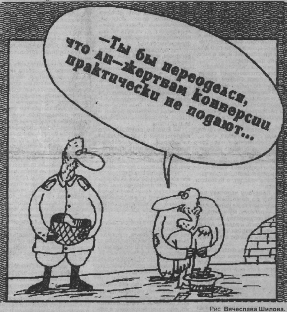
Рис. Вячеслава Шилова.