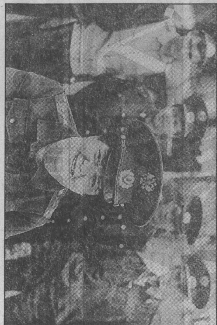
Зато, что с ней они чувствуют себя уверенно, зато, что она по-прежнему в строю.

Там, кто носит очки, хоро-шо знают, что такое «Ор-динарность» с запиской «Ор-динарность» на доске. Сидя на тоном на работе, но и со всей ответственностью люди, кото-рым необходима перспектив-ная работа. Сидя на доске, ор-динарность с запиской «Ор-динарность» на доске. Сидя на тоном на работе, но и со всей ответственностью люди, кото-рым необходима перспектив-ная работа.