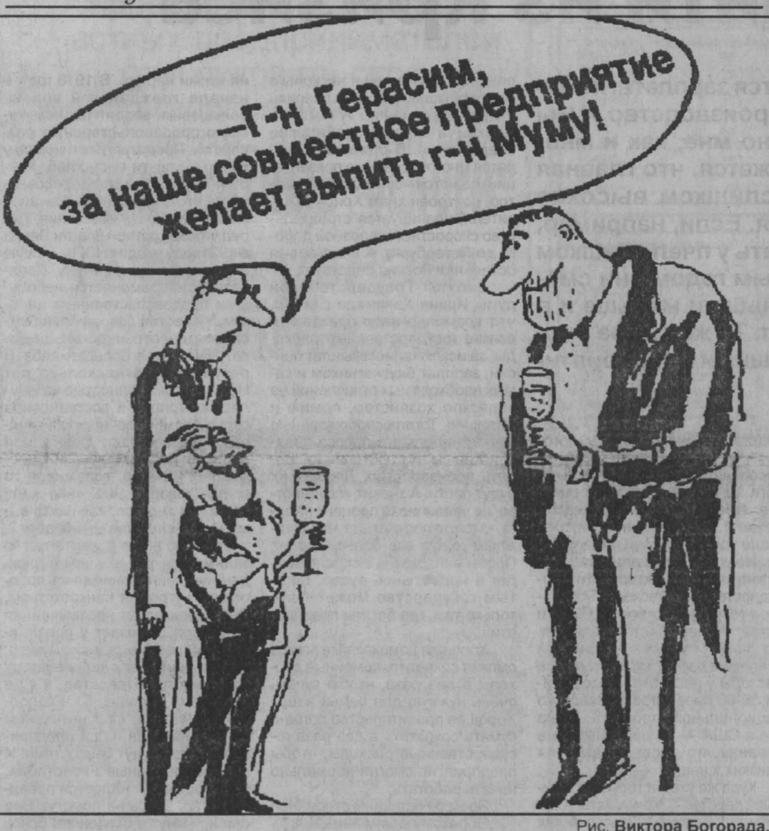
Рис. Виктора Богорода.