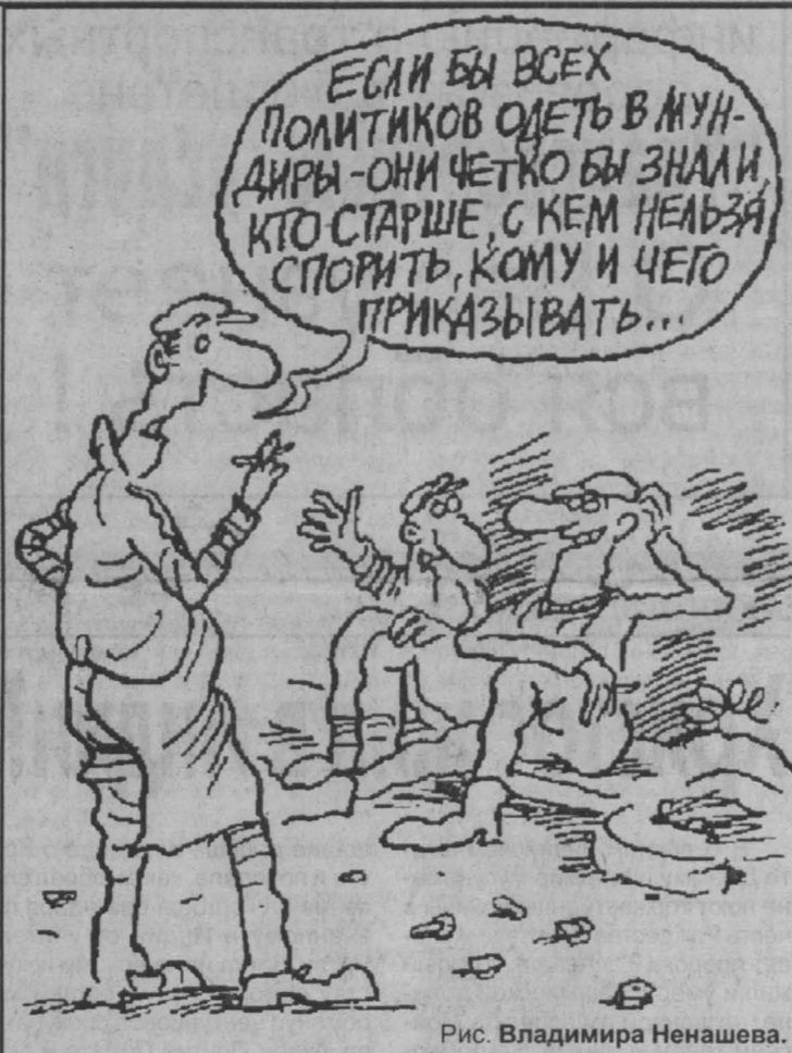
Рис. Владимира Ненашева.

Если будете строго следовать этой схеме, успех практически обеспечен. В суд на вас точно не подадут. Звания продажно-