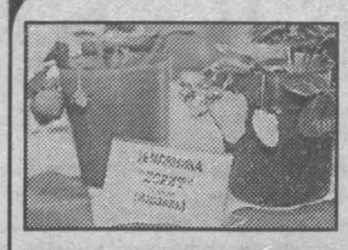
В очередной раз совхоз «Суховский» провел презентацию своей продукции.

В Кемерове состоялся традиционный турнир по вольной борьбе, посвященный Дню Победы, на призы губернатора области.