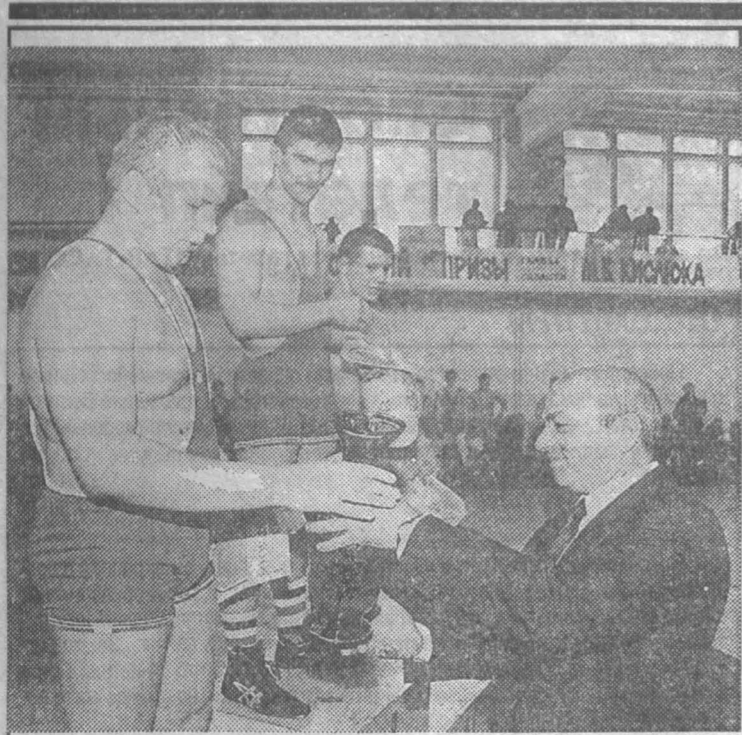
Восьмой традиционный турнир по вольной борьбе, посвященный Дню Победы, на призы губернатора области М. Б. Кислюка собрал 129 сильнейших юных борцов в возрасте до 18 лет со всех городов Кузбасса.