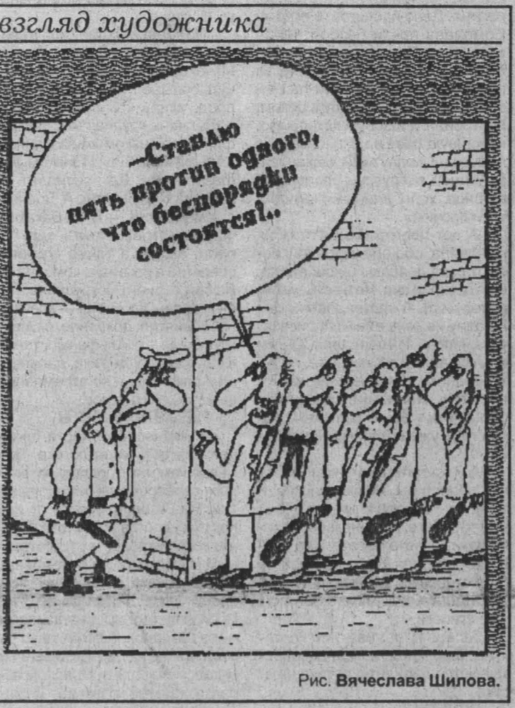
Рис. Вячеслава Шилова.

Задолго до его начала в воздухе витала нервность. В администрации чиновники, считая, готовились к штурму здания — припрятавали ценные документы и на время покидали свои рабочие места. Подтягивались в Анжерку и милицейские силы из соседних городов и сельских районных центров. На главную площадь Анжеро-Судженска к 11 часам стали подходить горюжне. К началу митинга их было уже более двух тысяч. Все уже знали, что обещанных денег шахтерам не будет, и это подогревало страсти. Выступавшие на митинге подпеты от власти убеждали бастующих горняков приступить к работе, иначе деньгам на зарплату взяться будет неоткуда. Шахтеры и бурно поддерживающие их бюджетники громко ругались, не желали никого слушать и в итоге проголосовали за новое перекрытие железной дороги. Переубедить, остановить их не смогли ни члены забастовки, ни представители сил властей и властных структур. Зарплату митингующие требовали тотчас, а не в срок до 25 мая,