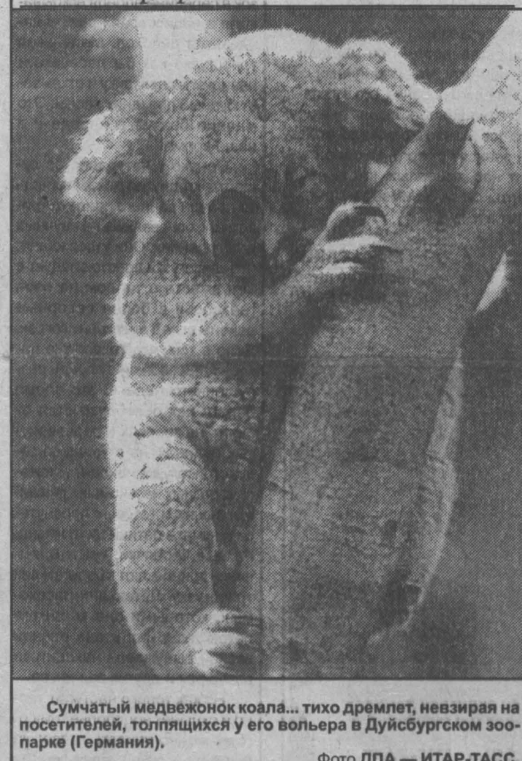
Сумчатый медвежонок коала... тихо дремлет, невзирая на посетителей, толпящихся у его вольера в Дуйсбургском зоопарке (Германия).