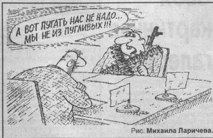
Рис. Михаила Ларичева.

Русские офицеры во все глаза смотрели на светящиеся изображение на радарных экранах: приближается ракета, через пятнадцать минут она ударит по Москве. Ракета размером приблизительно с американский «Грайдент», залущающаяся с подосновой лодки, двинулась со стороны Норвежского моря. В этот день, в январе 1995 года, между США и Россией не наблюдалось никаких особенных трений. Но офицеры знали, что в случае неожиданного нападения первой прилетит именно ракета с подлодки, она взорвется над Россией и породит магнитную бурю, которая «закарит» все электронные контуры. Предупреждение о возможном ядерном нападении было передано в подземный контрольный центр в югу от Москвы.