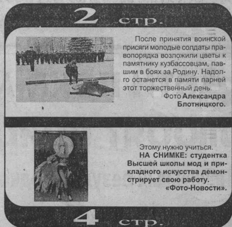
2 стр. После принятия воинской присяги молодые солдаты правоохранительных органов возложили цветы к памятнику кузбассовцам, павшим в боях за Родину. Надолго останется в памяти парней этот торжественный день.