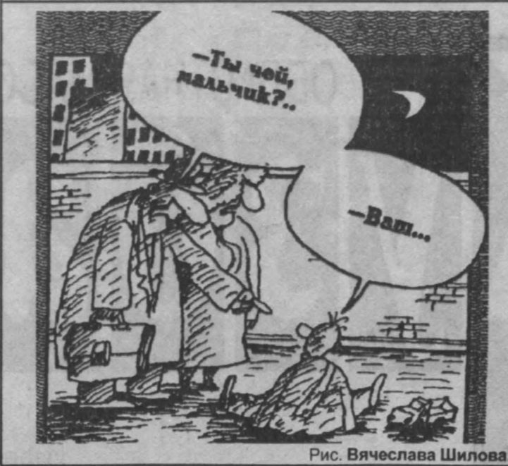
Рис. Вячеслава Шилова.

городских СЮТ стали центрами, как мы говорим, дополнительно-го образования. В том же роде действуют полторы тысячи школьных кружков натуралистов, четыре экологических клуба и центра. Изучая их работу, мы обнаружили, как разнообразно специалисты строят природоохранное воспитание. Дети ведут полевые и экспедиционные работы, в иных школах организуют профильные лагеря. В-четвертых, оборудуют ридники или ухаживают за лесом, помогают лесовосстановлению. Традиционны в области молодежные акции «Малым рекам — большую заботу», «День Земли», различные экологические слеты и олимпиады.