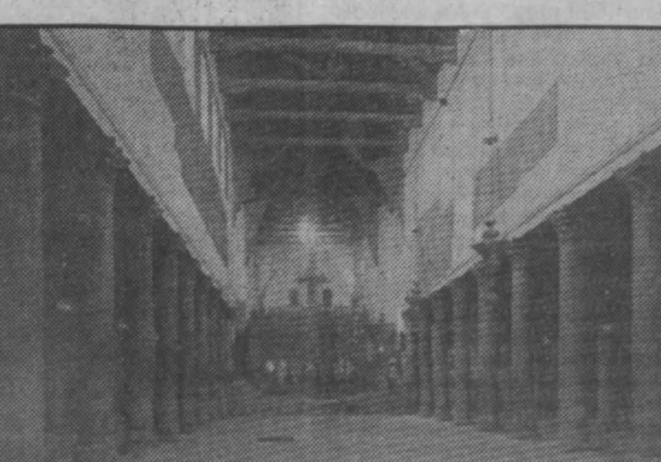
Собор Рождества Христова в Иерусалиме.