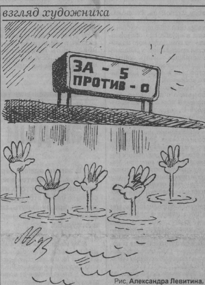
Рис. Александра Левитина.

Шахтеры, возмущенные длительной задержкой заработной платы, бросились к крайней мере — забастовке и сыграли на руку тем, кто лишь искал повод, чтобы избавиться от еще одной шахты. Не обострило ли «Росуголь» и обстоятельство, что такое «дикое» закрытие далеко от требований диверсификации. Ведь поскольку «Центральная» не входила в список неперспективных, то никто и не готовил технико-экономического обоснования этой акции. А в нынешней ситуации на подготовку, утверждение и экспертизу потребуется не менее семи-восьми месяцев. Конечно, при таком положении был резон продолжать работать тем службам, которые остаются на «Центральной» после того, как основная часть горнорабочих перейдет на соседние шахты. Этот вариант обсуждался в «Прокопьевскуголь». На совещании с инженерно-техническими работниками «Центральной» была рассмотрена программа ее деятельности. Правда, чтобы дать ей возможность остаться на плаву, пришлось бы сократить обслуживающий персонал и повысить сиюминутную нагрузку на забой, посылку за время забастовочного простоя коллектив потерял миллиард рублей. В том, что шахта оказалась в сложном положении, немалая вина и самого