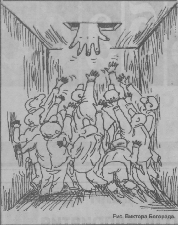
Рис. Виктора Богорада.

Сколько же все-таки стоит у нас вода, продолжала эта женщина, и почему столько, если «Азот», оказал его замдиректора, за воду денег не берет, бензин и зарплату водителям водовозок оплачивает?