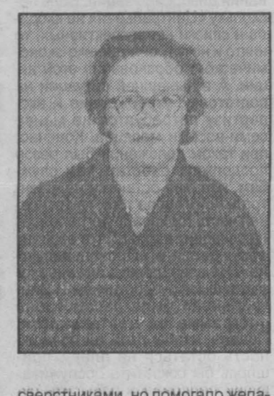
сверстниками, но помогало желание быть нужной.

Было трудно, не хватало педагогического опыта. Многие воспитанники были почти что ее