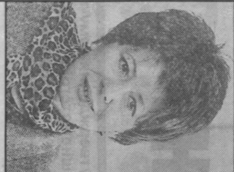
6. Для кого выставка — ярмарка незнакомая, часто творчество, подвиг на нее. Ответы специализации на некоторые предположительные вопросы, надеюсь, помогут вам стать раскованнее, извлечь собственную выгоду на ярмарке.