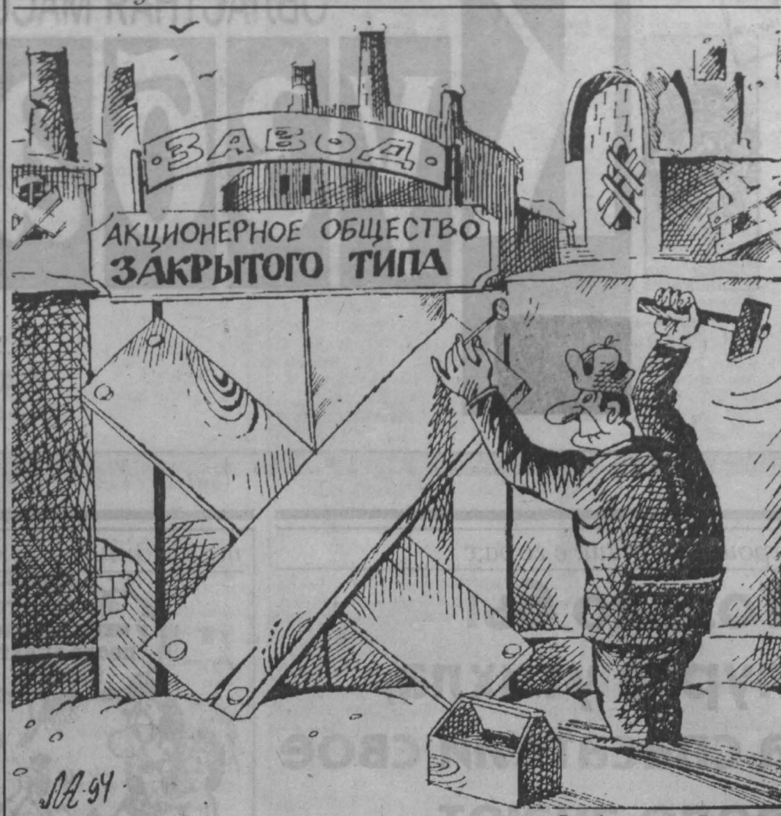
Рис Александра Левитина.

лориферы, горят шахтовые вентиляторы, выходит из строя иное оборудование. Шахтам грозит даже опасность затопления.