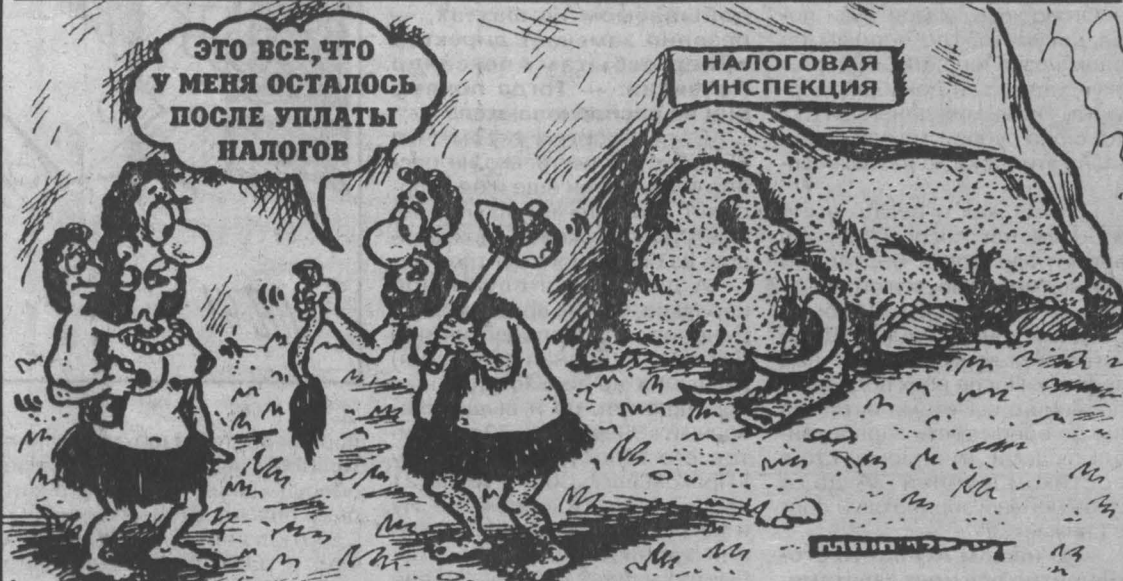
Рис. Александра Маркелова.