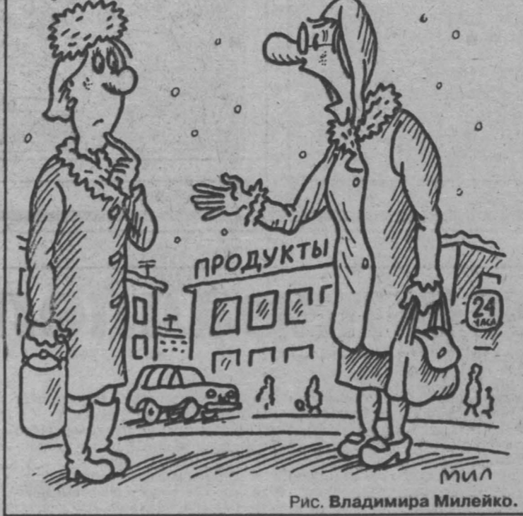
Рис. Владимира Милейко.

— Говорят, сначала с денег уберут три нуля, а затем и остальные цифры!