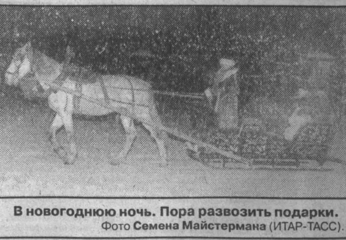
В новогоднюю ночь. Пора развозить подарки.

Любители активного отдыха могут встретить Новый год на горнолыжных комплексах туристической фирмы «Шория-тур». Здесь их ожидает традиционный банкет со Снегурочкой и Дедом Морозом, различные игры, конкурсы, ночная дискотека, сказочные ночные катания на горных лыжах по освещенным трассам. Праздник продлится до 4-5 часов утра. На этот раз год Тигра встретят 250 счастливых чиков. Старый и Новый год в Горной Шории встретят также гости с туристической поезда из Новосибирска. А еще два турадетства прибудут в Шорию 2-го и 3 января. г. Таштагол.