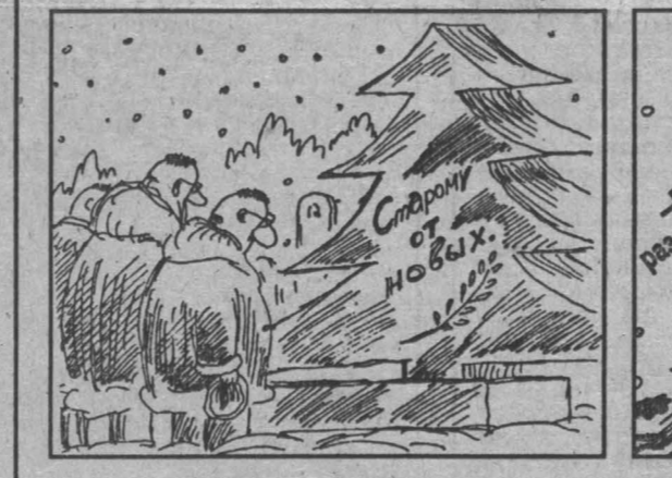
Рис. Виктора Богорада.