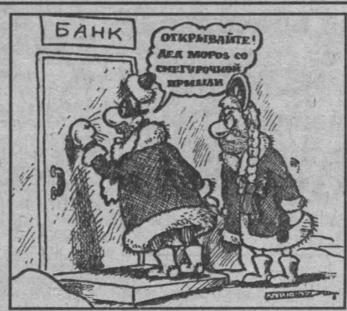
Рис. Александра Маркелова.