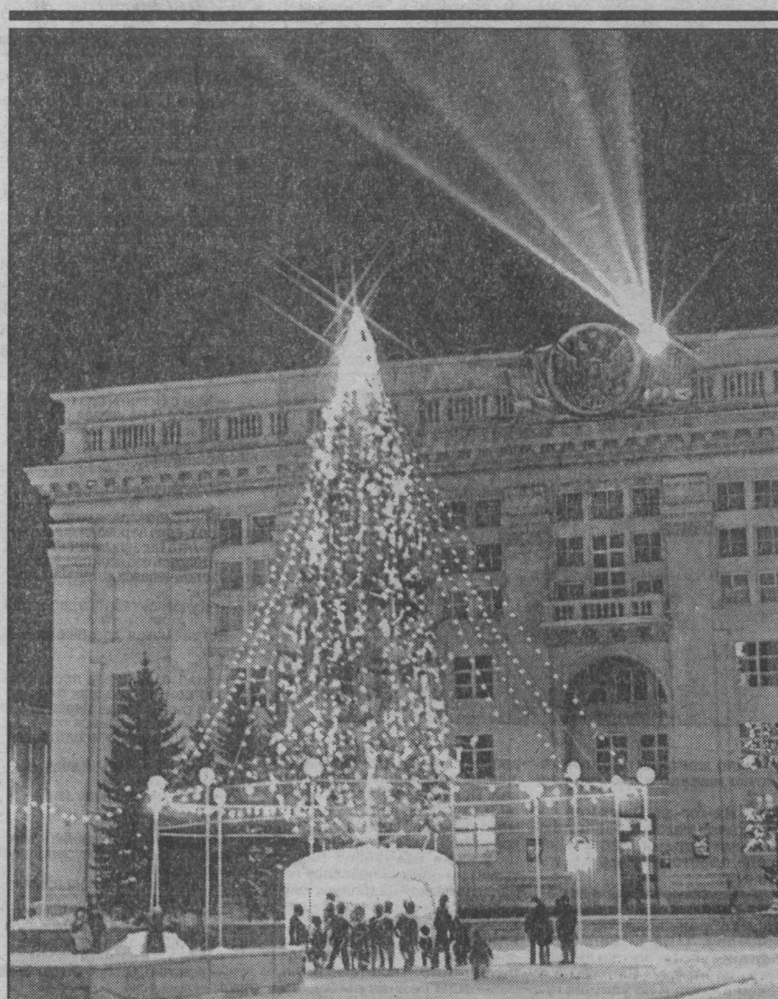
Огни главной елки Кузбасса.

— Выпьем за то, чтобы пить только в праздники, которых будет все больше!