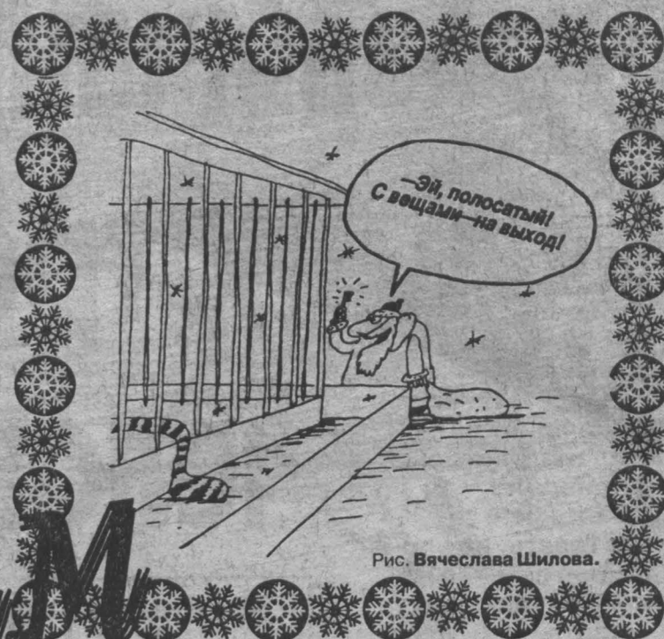
Рис. Вячеслава Шилова.