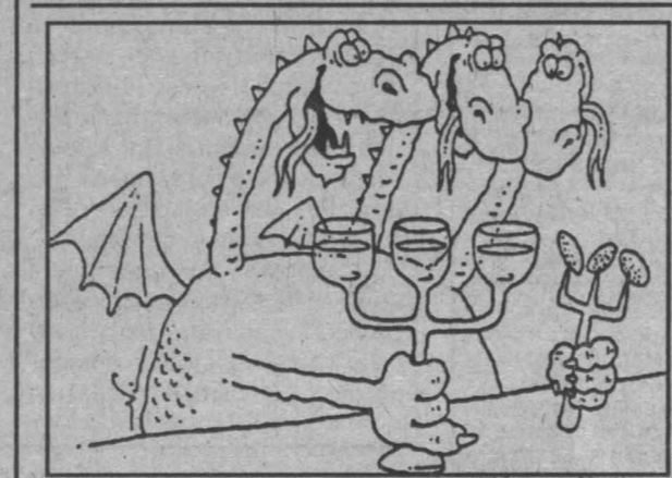
Рис. Игоря Кийко.