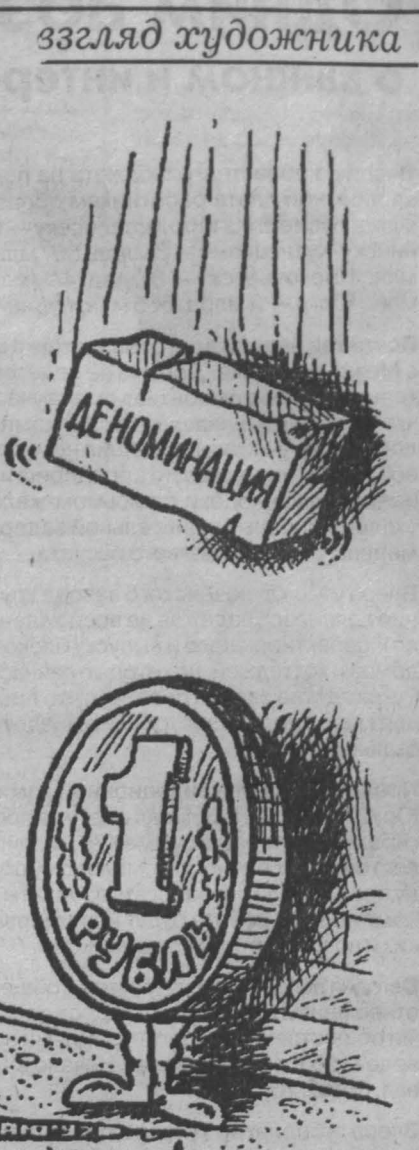
Рис. Александра Маркелова.

Банки банками. А главная тяжесть работы одновременно со старыми и новыми деньгами, привыкания к новому счету ляжет на торговлю. И она готовится к переменам без спешки. Цепочки в старом и новом масштабе цен стали привычными покупателям. (Многие ли уже тренируются в подсчетах?) С руководителями торговых предприятий обговорены условия адаптации кассовых аппаратов. Начальник областного департамента торговли П. А. Алексеев изложил ситуацию коротко и четко.