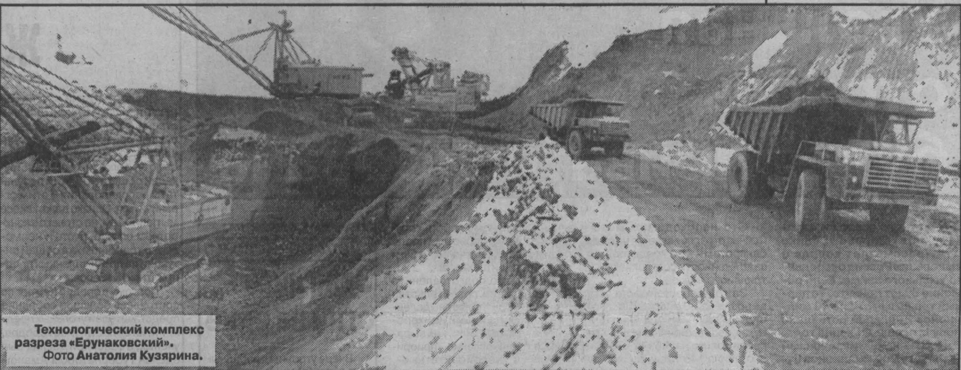
Технологический комплекс разреза «Ерунаковский».