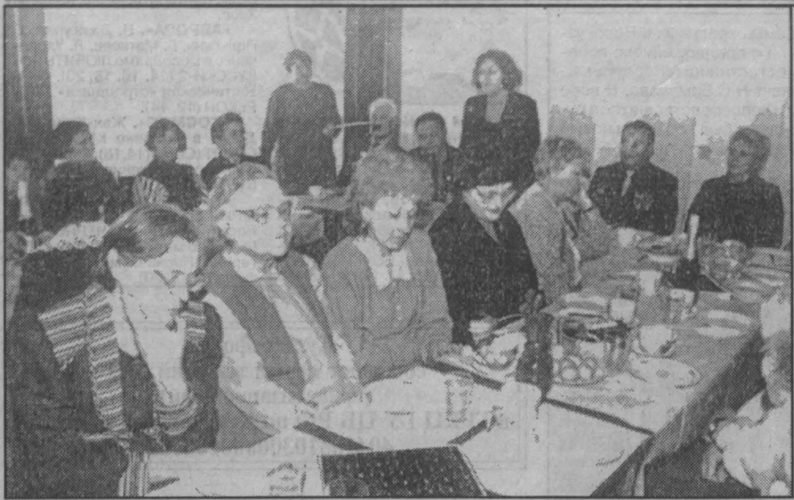
Дню матери посвящается