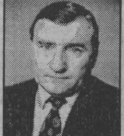
ПАЙГИН Юрий Федорович

Заместителем губернатора Кемеровской области по внешним экономическим связям назначен ПАЙГИН Юрий Федорович .