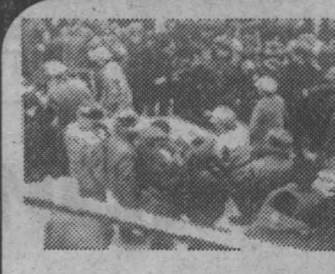
По мнению ученого, взрыв на шахте «Зырянская» мог способствовать изменению солнечной активности. Доказано, что природные явления заметно влияют на поизво- ственную сферу. НА СНИМКЕ: трагедия на «Зырянской».