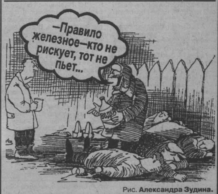
Рис. Александра Зудина.