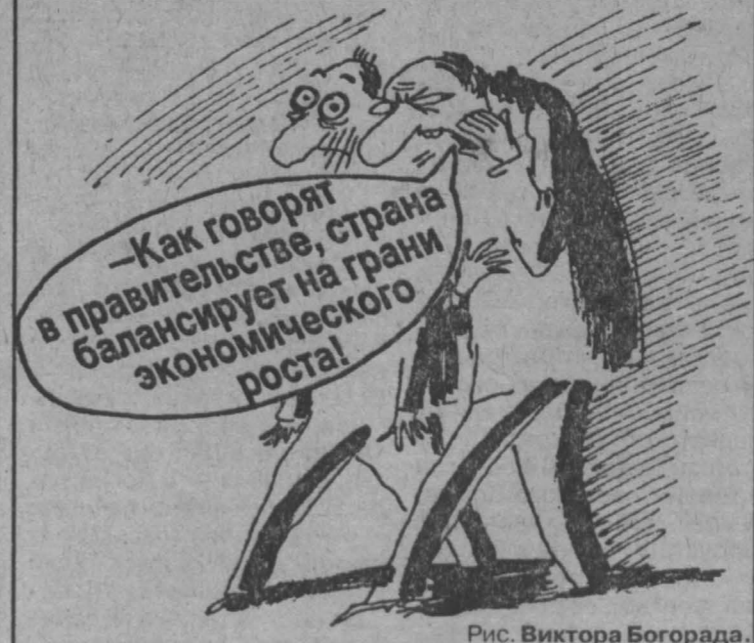
Рис. Виктора Богорада.