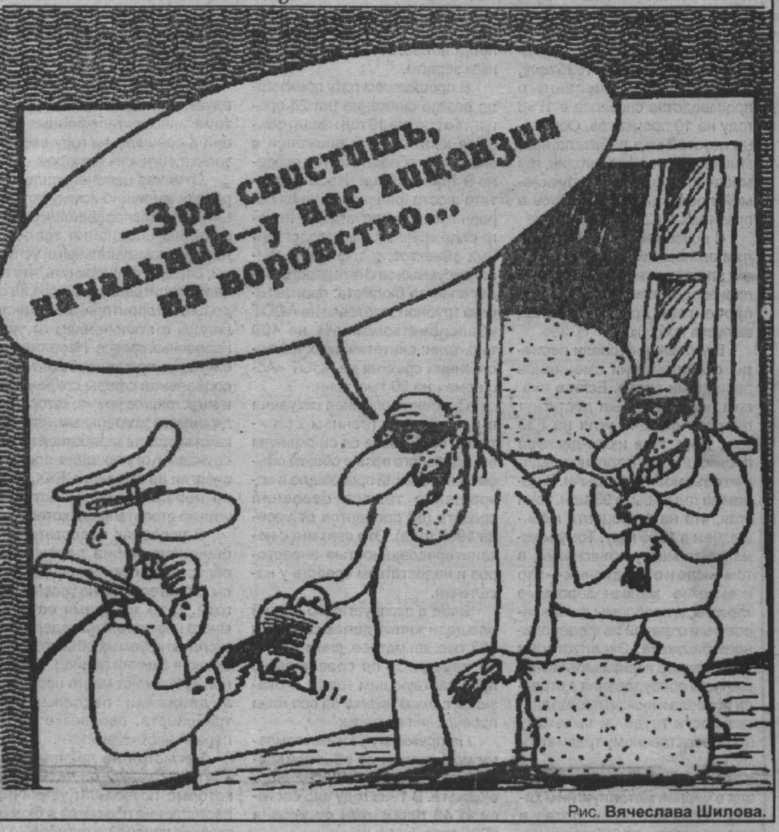
Рис. Вячеслава Шилова.