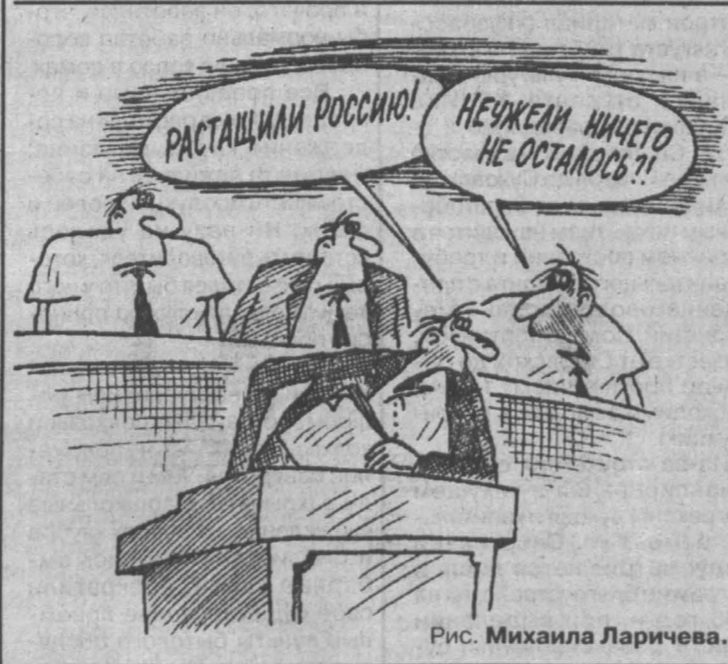
Рис. Михаила Ларичева.