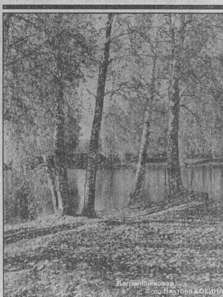
Вагрия, октябрь.