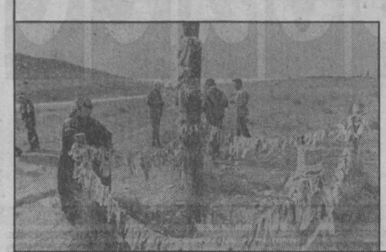
НА СНИМКАХ: Саяно-Шушенская ГЭС на Енисее; исполнение древнего обычая.