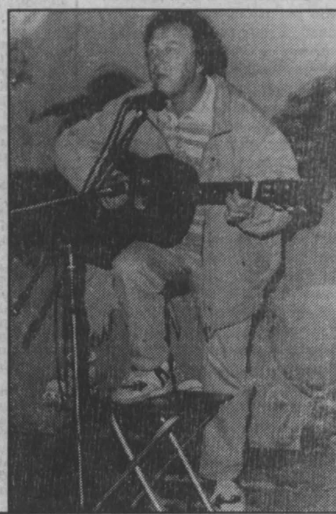
Л. ИЛЬИН. НА СНИМКАХ: эпизоды фестиваля «Бабе лето-97».

Есть удивительная сила, заставляющая людей мчаться за тридевять земель «за туманом и за запахом тайги», брать в руки ги-