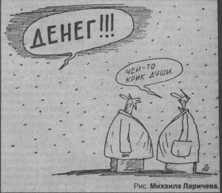
Рис. Михаила Ларичева.