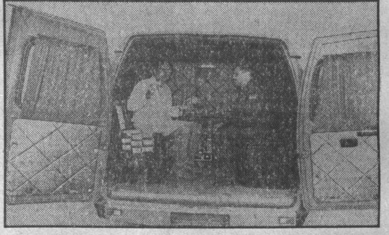
Томск. Специализированная экспресс-лаборатория, призванная ускорить и облегчить работу специалистов, создана в экспертно-криминалистическом управлении УВД Томской области в рамках программы по борьбе с незаконным оборотом наркотиков.