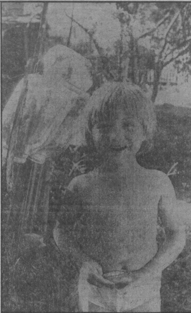
Лето в деревне.

До начала чемпионата мира китайская команда вместе со швейцарцами и спортсменами Белоруссии примет участие в товарищеских соревнованиях в Берне.