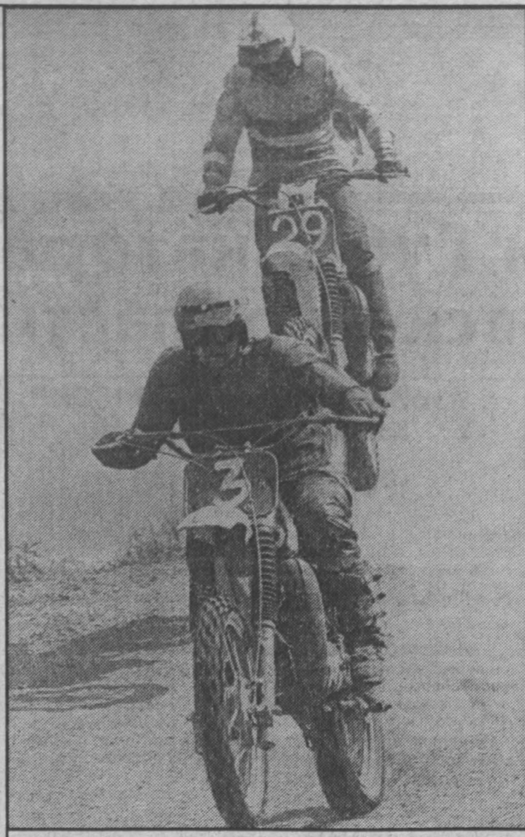
На двух этажах.