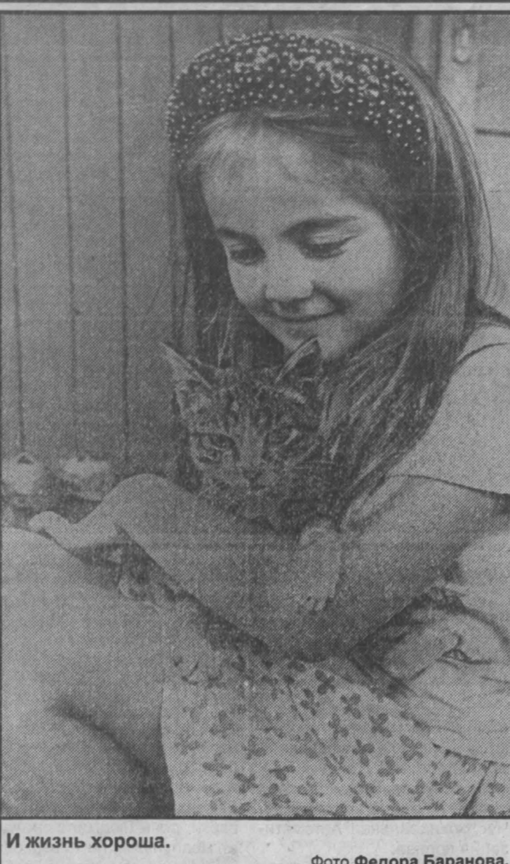
И жизнь хороша.