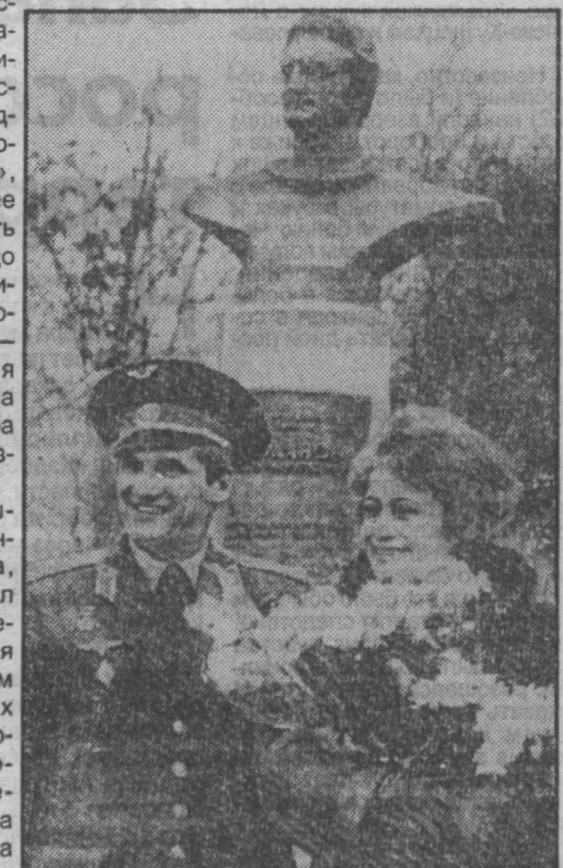
После открытия бюста Б. В. Волынова, дважды Героя Советского Союза, в г. Прокопьевске. 1984 г.